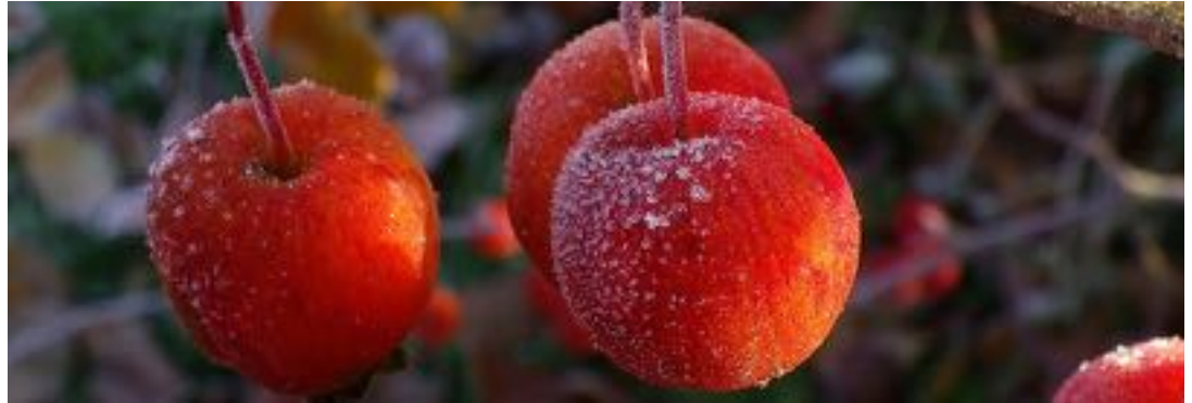
Fêtes de fin d'année : comment valoriser vos collaborateurs ?

Pour une lecture illimitée hors ligne, vous avez la possibilité de télécharger gratuitement cet article au format PDF :