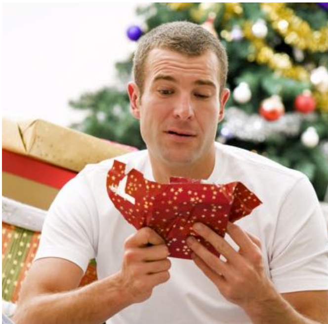
Alors, heureux...?!