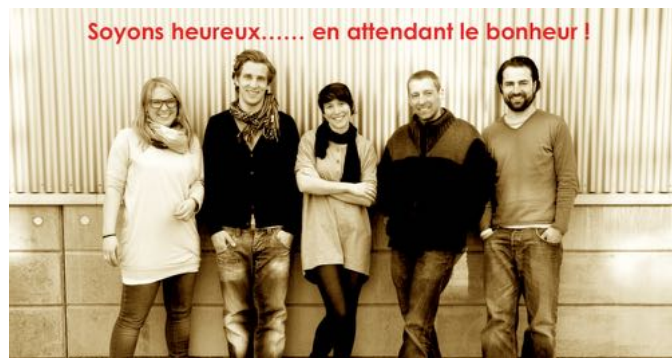
Soyeux heureux..... en attendant le bonheur !