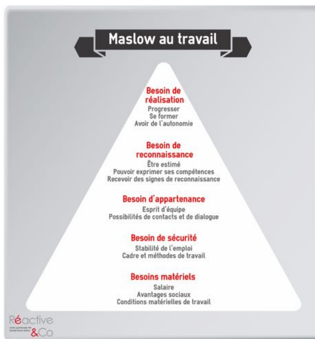
La pyramide de Maslow appliquée au monde professionnel.

« La question à se poser est donc la suivante : à quel besoin spécifique pouvez-vous répondre pour chaque collaborateur ? »